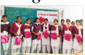
Schoolgirls hold reusable sanitary napkins provided by the Sirsa district administration.